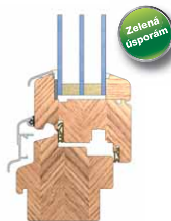
Řez okenním profilem EURO IV 88

Tepelná izolace: U_w \leq 1,2 \text{ W/m}^2\text{K}