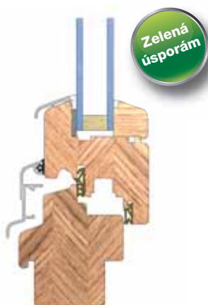
Řez okenním profilem EURO IV 68

Splňuje podmínky programu Zelená úsporám