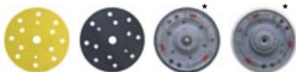
Strojní podložka Hookit 15 děr 861A 150 mm průměr